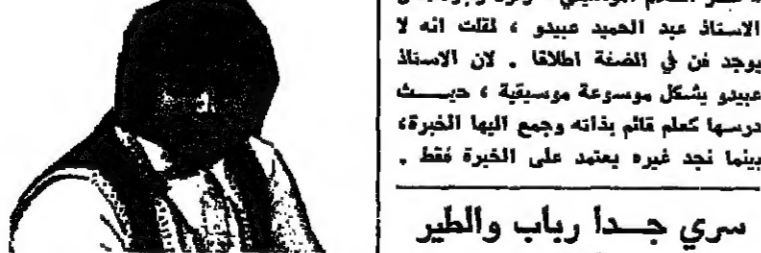
هل تذكر لنا اسما المازنوني فسي «صوت الفن» ؟